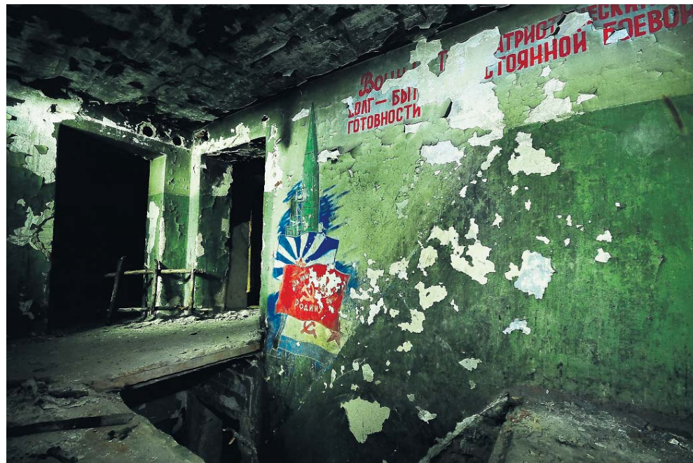
▲ Ondergronds commandocentrum van silolanceerbasis Haisyn met propagandistische muurschilderingen.

Bruining werd door zijn vriend aangestoken. 'Het fascineert me om rond te lopen op plekken die dertig jaar geleden volkomen ontoegankelijk en geheim waren. Om te bedenken dat in the middle of nowhere voor ongelooftelijke bedragen aan supergeavanceerde wapens stonden opgesteld die ons in het Westen enorme angst aanjoegen maar nooit zijn gebruikt. Nu zijn die locaties ontmanteld en teruggeven aan de natuur. Ze raken langzaam overwoekerd en over een paar decennia vind je ze niet meer terug en straks weet niemand meer dat ze bestonden. Wij leggen het verleden vast voor het verdwenen is.' De eerste reis van de twee vrienden ging naar Oekraïne, waar de meeste bases te vinden zijn. Litouwen, Letland en de voormalige DDR volgden. Hun tocht bracht ze in de meest afgelegen oorden. Bruining: 'We hebben een tentje achterin de auto liggen zodat we wild kunnen kamperen. Zo'n basis ligt per definitie ver van de bewoonde wereld, vaak in de bossen en het liefst aan de rand van een moeras. Dat is fijn als je stil moet staan om te fotograferen. Je bent levend voor voor de muggen.' Het is elke keer weer een bijzondere ervaring om