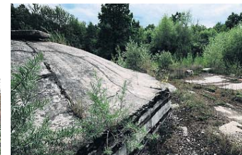
▲ Silolanceerbases Lutzk, Khmel'nitsky, Kolomyia en Haisyn (vanaf linksboven met de klok mee).

zo'n plek te vinden. Bruining: 'Op een gegeven moment houdt de weg op en bonk je met de auto verder over betonplaten. Ook dat houdt op, dan parkeer je ergens om vervolgens nog een heel eind te moeten lopen. Uiteindelijk bereik je dan zo'n leeg en verlaten betoncomplex. Een keer vonden we sporen van bewoning en een enorme rode vlek op de muur. Daar schrik je wel even van, maar het bleek gelukkig rode verf te zijn.' In de ondergrondse silo's dwalen ze rond door het pikkedonker, net als mijnwerkers met lampjes op